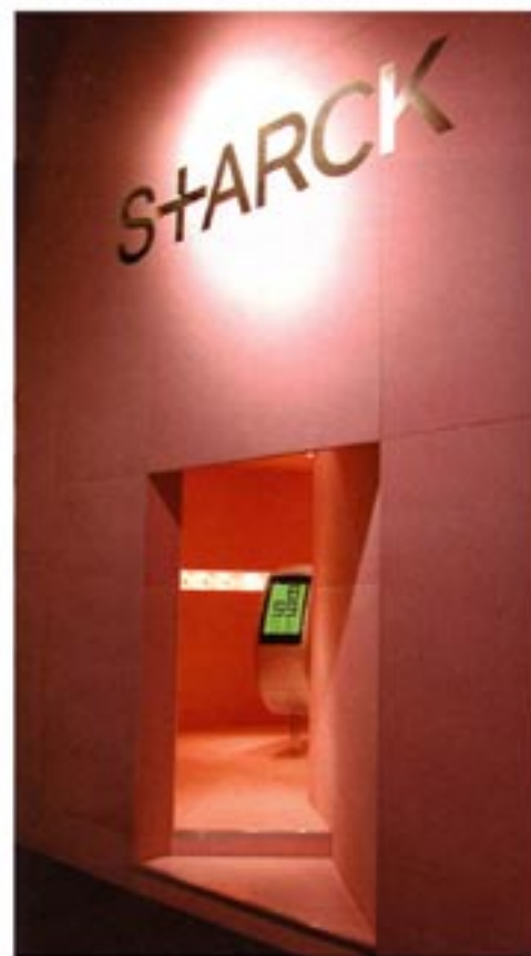
Le stand Fossil sur la foire de Bâle par l'agence Brandstorm